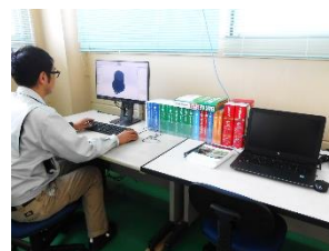
CAD 3D(Solid Works)